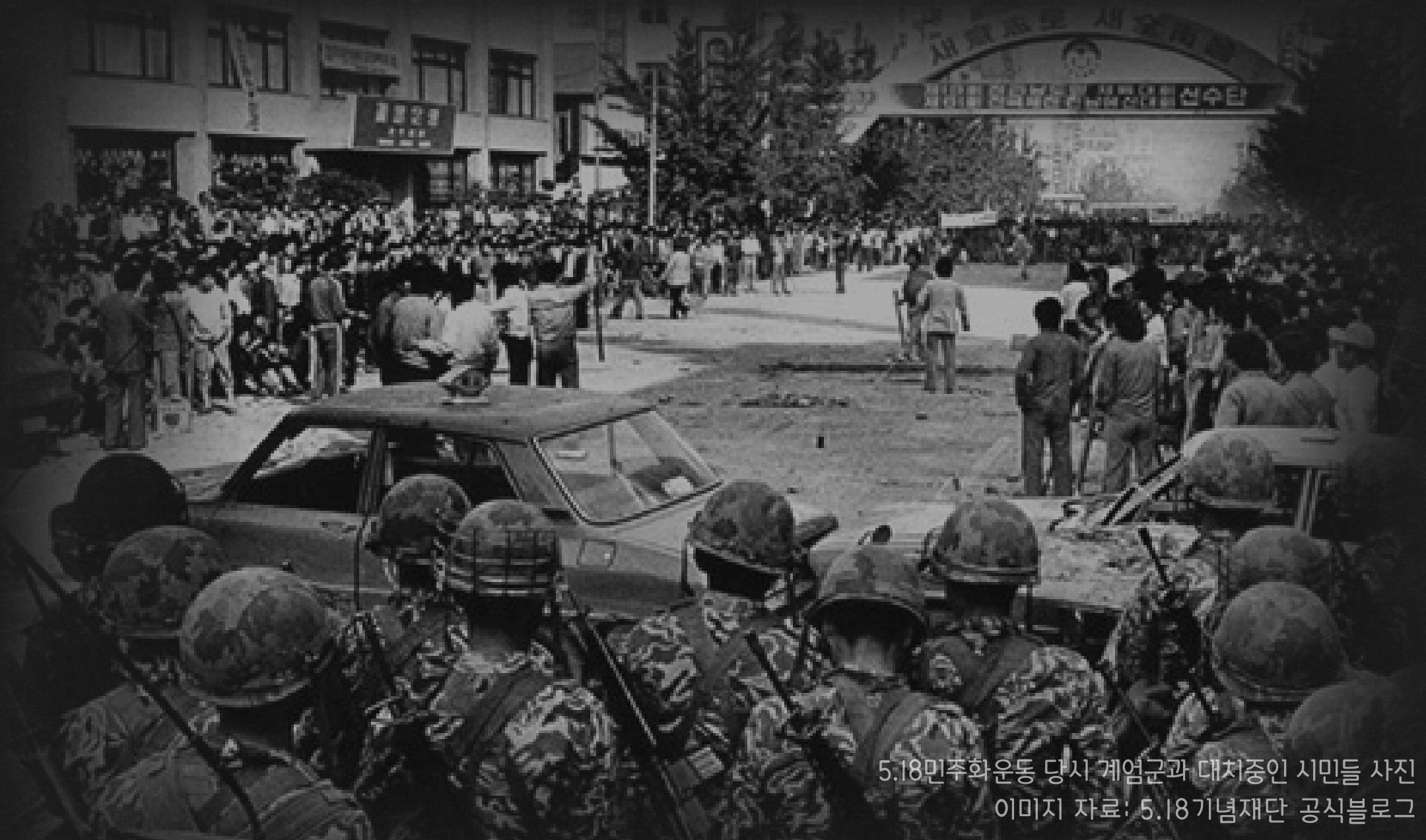
5.18민주화운동 당시 계엄군과 대치중인 시민들 사진 이미지 자료: 5.18기념재단 공식블로그